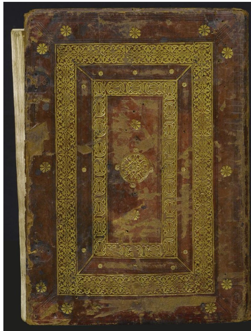
Milano Archivio Storico Civico e Biblioteca Trivulziana, Cod. Triv. 166 (piatto posteriore)